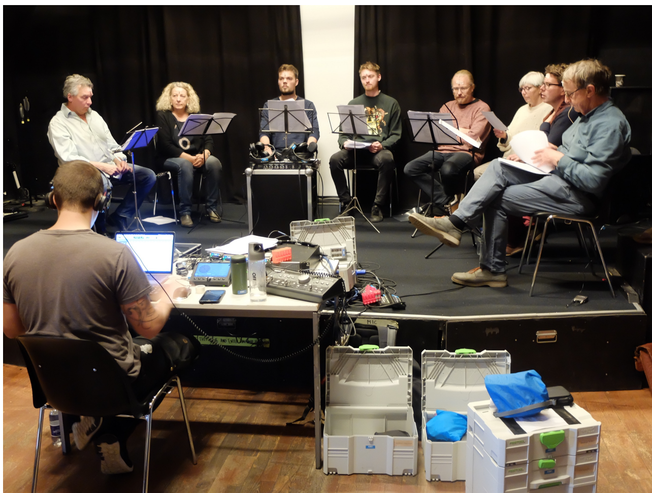
Fra optagelserne i oktober 2017 på "Spillestedet Harders" i Svendborg

Stykket er indspillet i surround - sound og opføres i en mørkelagt biografstal.