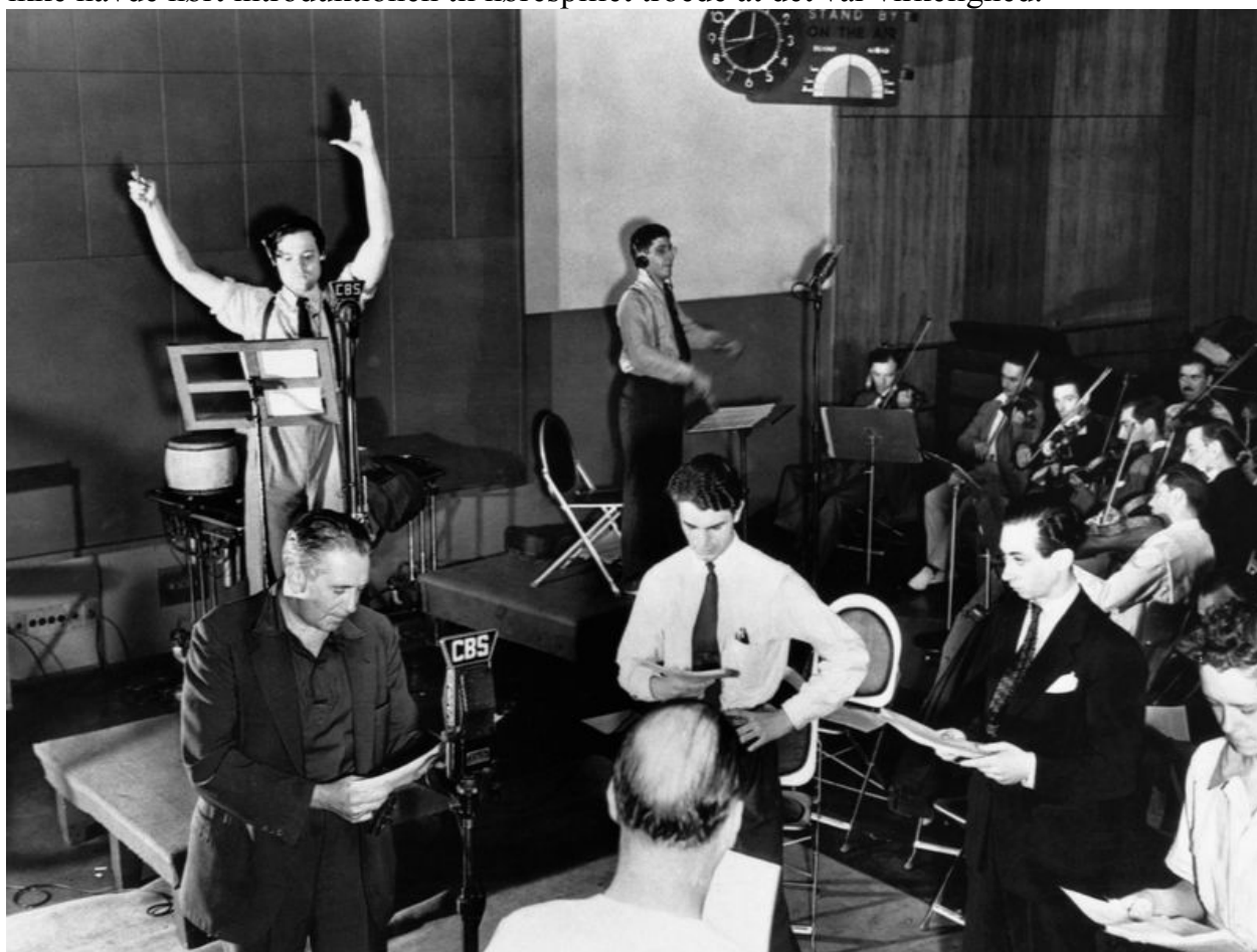
Wells instruerer "Klodernes Kamp"

Det mest berømte hørespil er dog "Klodernes Kamp" instrueret af Orson Wells (1938). Det opskræmte store dele USA og sendte folk på flugt for en hær af aliens, der var landet i på nøje angivne steder og nu var på vej i forskellige retninger. Hørespillet var bygget op som en reportage med flere journalister der berettede fra forskellige steder i landet og folk der ikke havde hørt introduktionen til hørespillet troede at det var virkelighed.