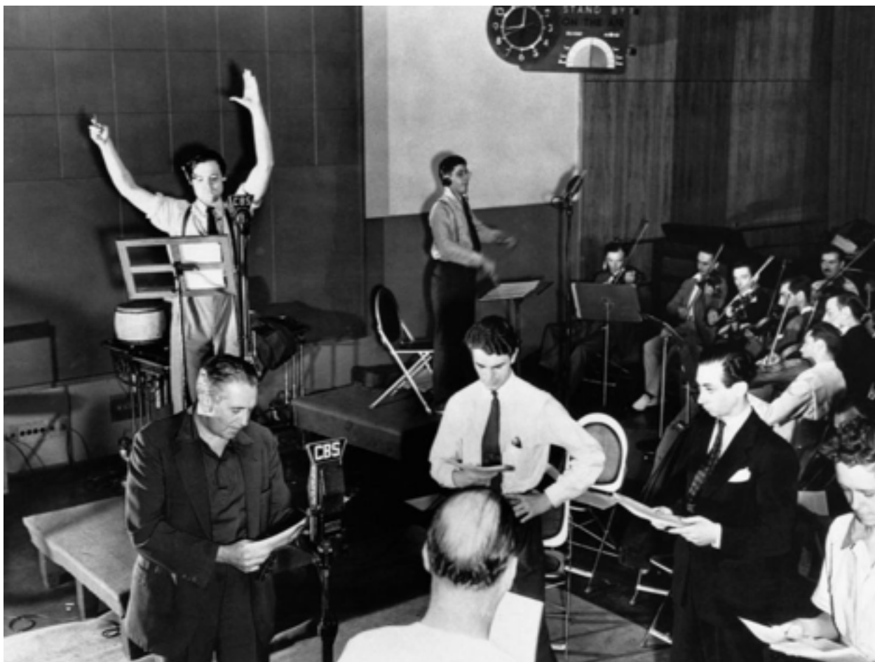
Orson Wells instruerer "Klodernes Kamp"

En del hørespil var så populære at der var meget få mennesker på gaderne mens de blev sendt. Familierne samledes omkring radioen og lyttede til spændende kriminalserier eller gysere. I Danmark blev især "Gregory-mysteriet" fra 1954 og "Sivah-skriget" fra 1956 hørt af mange tusind mennesker.